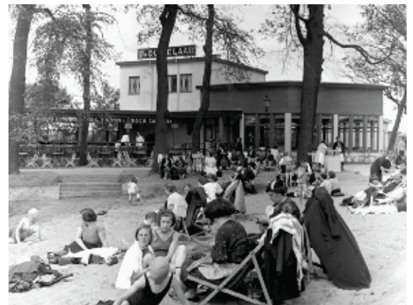
Het Noordkasteel werd na 1934 een recreatiegebied met openluchtzwembad en roeivijver.